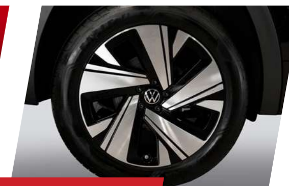
Mâm xe Luxury