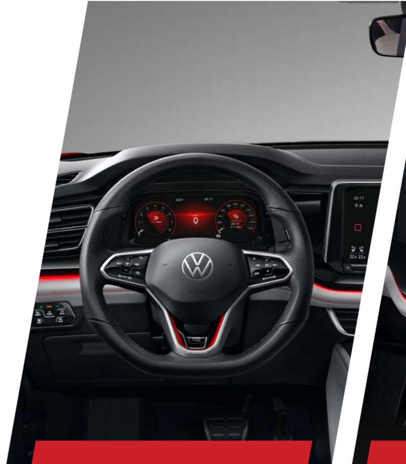
Vô lăng thể thao R-line

Với công tắc chuyển số điện tử nhỏ gọn và sang trọng, nút khởi động start-stop thiết kế thuận tiện trong tầm tay.