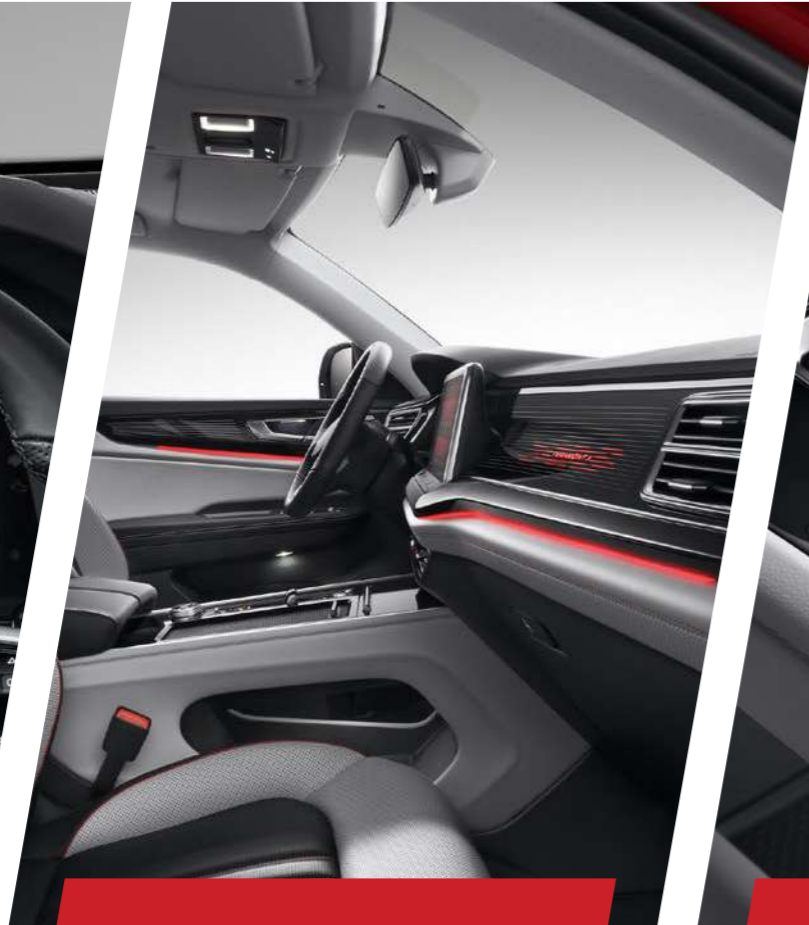
Đèn viền trang trí nội thất Ambient Light

Màn hình đa sắc màu lựa chọn 3 giao diện khác nhau, 30 màu nền. Hiển thị đầy đủ thông số lái xe, đèn cảnh báo, đồng hồ tốc độ, tua máy.