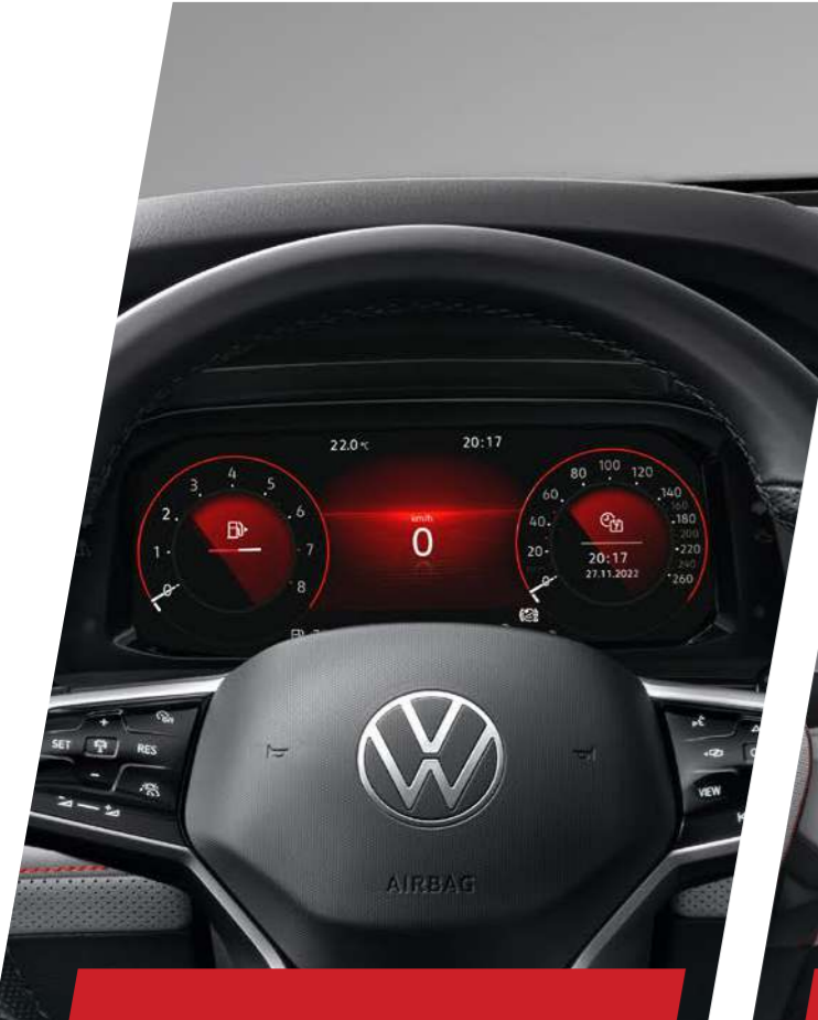
Đồng hồ kỹ thuật số 10.3 inch

Màn hình đa sắc màu lựa chọn 3 giao diện khác nhau, 30 màu nền. Hiển thị đầy đủ thông số lái xe, đèn cảnh báo, đồng hồ tốc độ, tua máy.