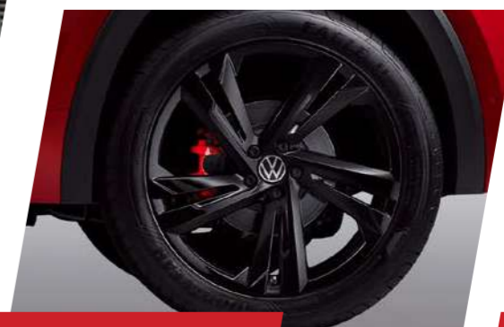
Mâm xe Platinum