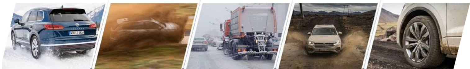
Độ ẩm không khí

• Khung gầm xe an toàn. Thép có độ bền và khả năng chịu lực cao được áp dụng cho thân xe với tỷ lệ lớn lên đến 82%, trong đó thép tạo hình nóng chiếm 24%. Điều này không chỉ làm tăng độ cứng vững và độ bền của thân xe, mà còn nâng cao cảm giác lái và tiết kiệm nhiên liệu. Công nghệ hàn Laser tiên tiến và công nghệ sơn tĩnh điện đảm bảo khả năng chống ăn mòn lên đến 12 năm.