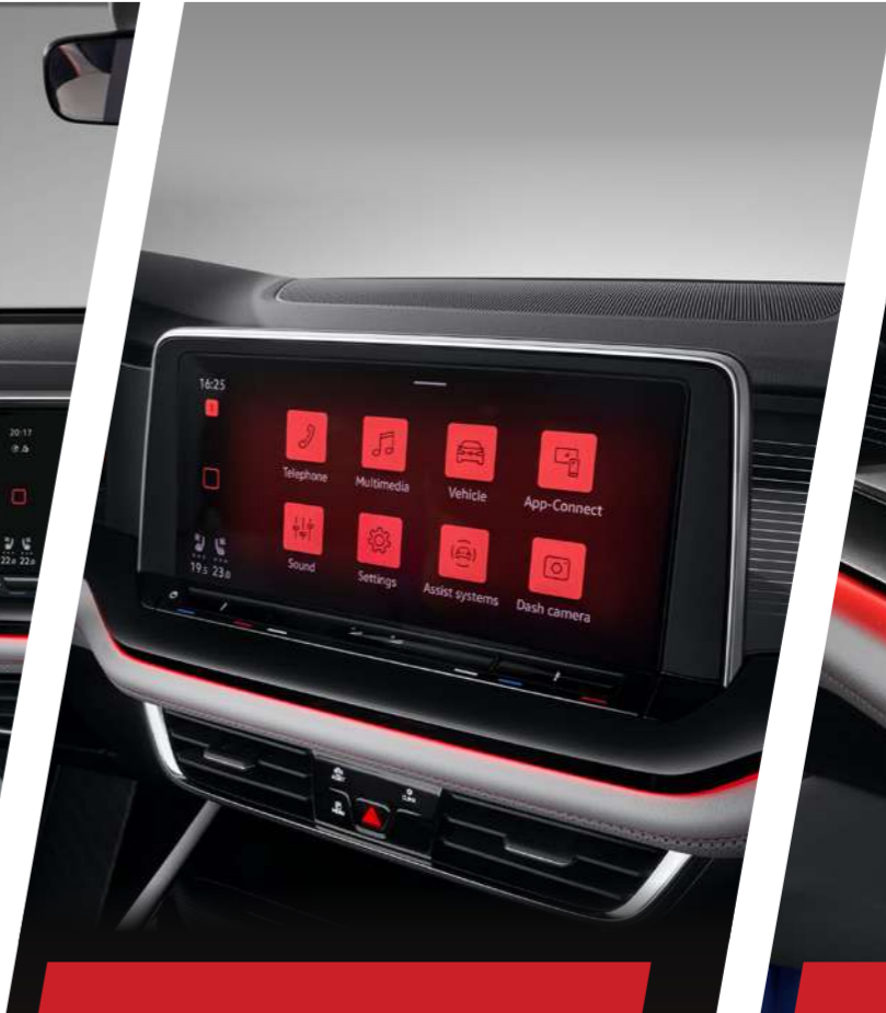
Màn hình đa chức năng 12 inch

Vô lăng bọc da, viền trang trí màu đỏ, tích hợp các phím điều khiển đa chức năng thuận tiện.