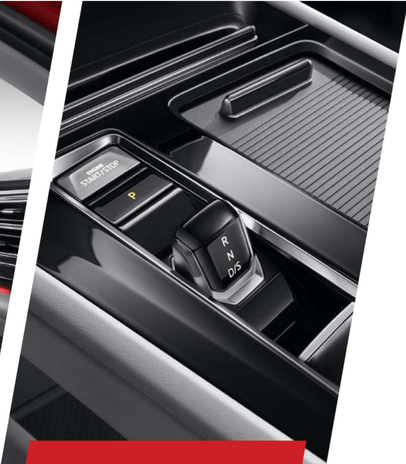
Khu vực điều khiển trung tâm thiết kế hiện đại

Lựa chọn 30 màu sắc mang lại trải nghiệm thư thái và góp phần tăng thêm sự sang trọng cho không gian nội thất.