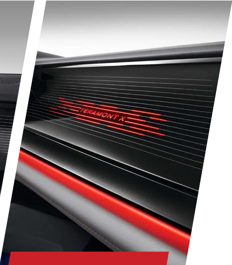
Điểm nhấn trang trí ấn tượng

Kết hợp các chức năng giải trí và điều khiển cài đặt các hệ thống trên xe. Điều khiển bằng cảm ứng hoặc cử chỉ Gesture Control với độ nhạy cao và mượt mà. Kết nối Apple Carplay, Bluetooth, USB.