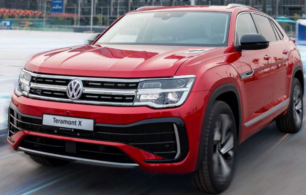
All New Teramont X